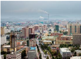
Khogno Khan 📍