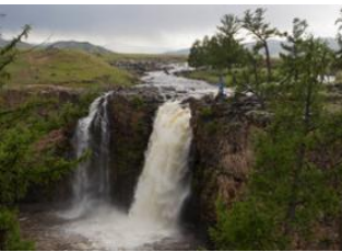
Orkhon -Tal ♡ 37km - ⌚ 5h 30m Boorgiin Oroï ♡