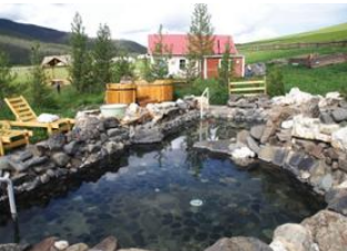
Boorgiin Oroï ♡ 🚗 190km - ⌚ 6h Tsenkher heißen Quellen ♡