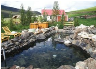
Boorgiin Oroï ♡ 🚗 190km - ⌚ 6h Tsenkher heißen Quellen ♡