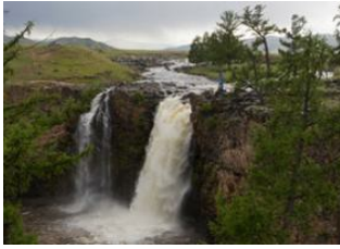
Orkhon -Tal ♡ 37km - ⌚ 5h 30m Boorgiin Oroï ♡