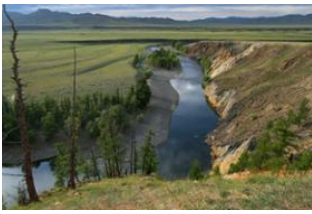
Khujirt 📍 35km - ⌚ 5h Ellenbogen von uurt 📍