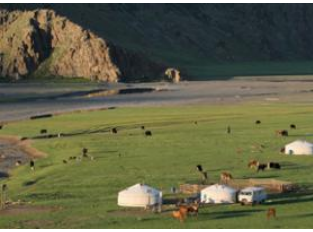
Ellenbogen von uurt ♡ 50km - ⌚ 7h Orkhon -Tal ♡