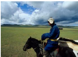
Kharkhorin 📍 42km - ⌚ 6h 30m Khujirt 📍