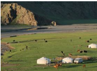
Ellenbogen von uurt 📍 50km - ⌚ 7h Orkhon -Tal 📍