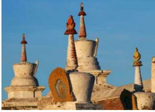
Khustai Nationalpark 📍 🚗 270km - ⌚ 4h 30m Kharkhorin 📍