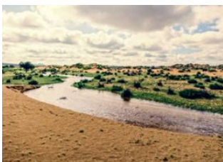
Tsenkher heißen Quellen ♡ 🚗 250km - ⌚ 4h Khogno Khan ♡