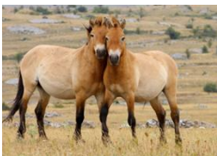
Ulan-Bator 📍 🚗 130km - ⌚ 2h 30m Khustai Nationalpark 📍