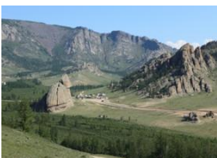
Ulan-Bator 📍 🚗 80km - ⌚ 2h Terelj-Tal 📍